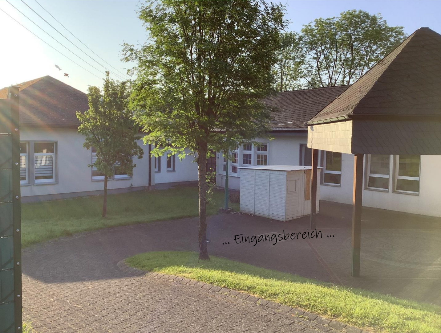
... Eingangsbereich ...